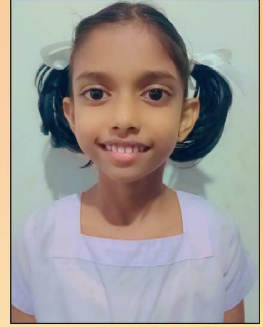
I.G එමාසා ලිතනි ගමගේ 1-E